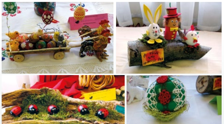
Na teh slikah je še nekaj aranžmajev iz let 2010 do 2013, na zadnji je obkvačkanonojevo jajce.

spletajo ptički v tem času (2009), potem je lesena skleda z lesenimi pirhi iz hruškovega lesa (2012), naprej sledijo lepo izdelani pirhi: prvi je obarvan s čebulnimi listi in okrašen z lesketajočo srebrno barvo in dodanim svetlikajočim »diamantom« na sredini (2010), tretji pa je narejen tako, da so na jajce lepo v vrstice nalepljena semena različnih rastlin, drugi je obarvan v teranu (2011).