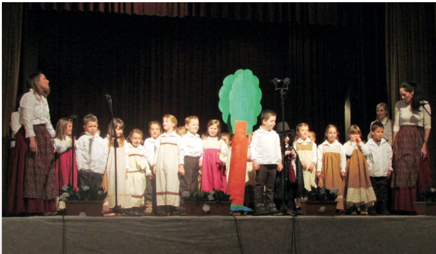
Nastop vrtca Škratek Svit Vodice