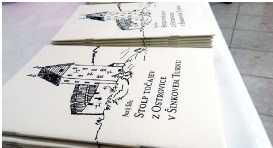
Stolp točajev z Ostrovice v Šinkovem Turnu