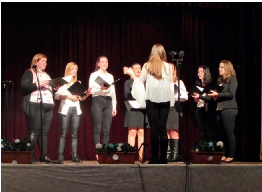
Dekliški pevski zbor Flora

Ob današnjem prazniku vam želiva, da bi znali bisere naše kulture (vse, ki sva jih omenila, in še druge), ki